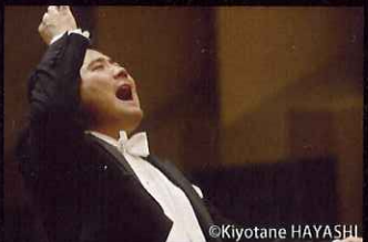
指揮者 菅野 宏一郎