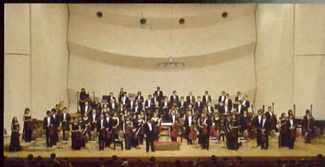
管弦楽 東京室内管弦楽団